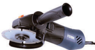
Γωνιακός Τροχός 850 W - 125 mm