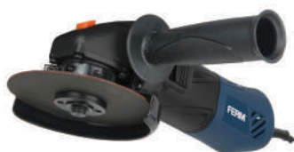
Γωνιακός Τροχός 500 W - 115 mm