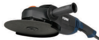
Γωνιακός Τροχός 2.500 W - 230 mm